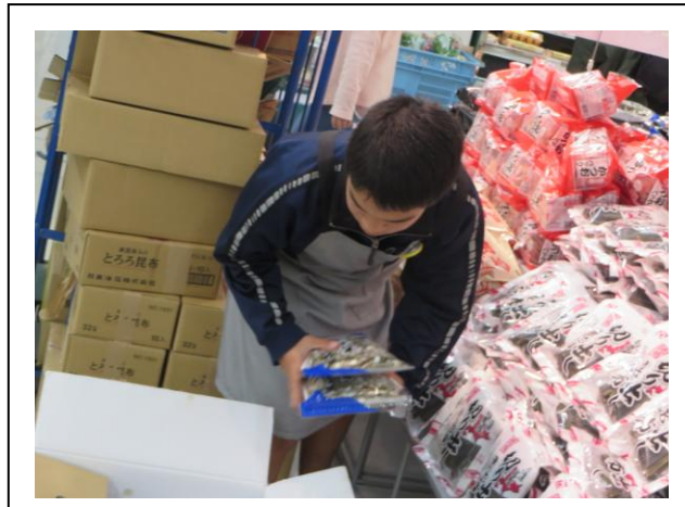
ゆめタウンおのだ