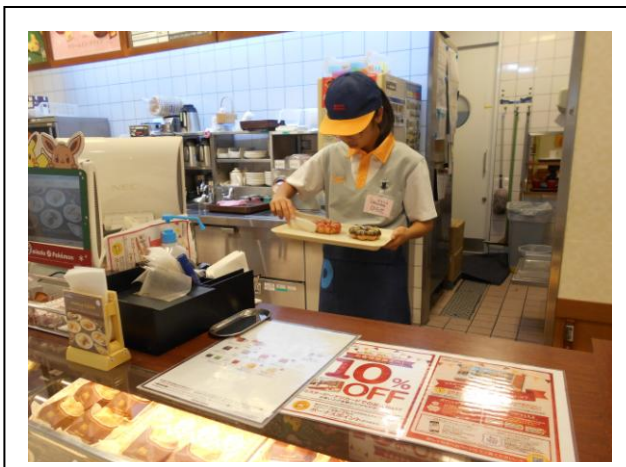
ミスタードーナツ