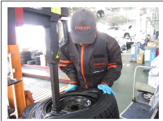
自動車整備 (トヨタ)