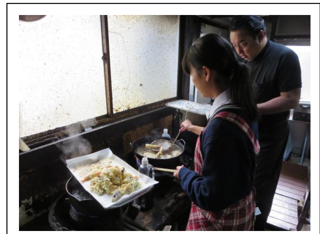
春 駒 亭