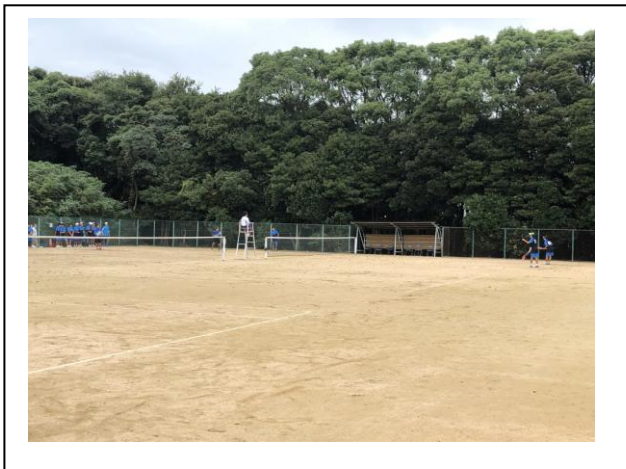
ソフトテニス男子