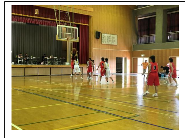
バスケットボール女子