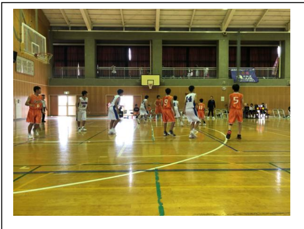
バスケットボール男子