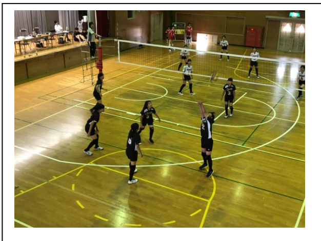
バレーボール女子